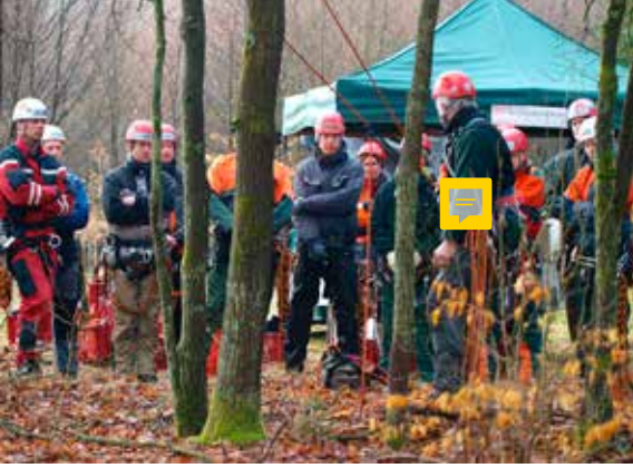
FSB SEILKLETTERSCHULE OERREL

Gern stehen wir Ihnen zu allen Fragen rund um Waldsamen, Pflanzenanzucht und Waldverjüngung zur Verfügung. Daneben bieten wir kompetente Ausbildung in der Seilklettertechnik, die nicht nur bei der baumschonenden Samenernte, sondern auch bei Baumpflege, Naturschutz, Wissenschaft und Freizeit Anwendung findet.