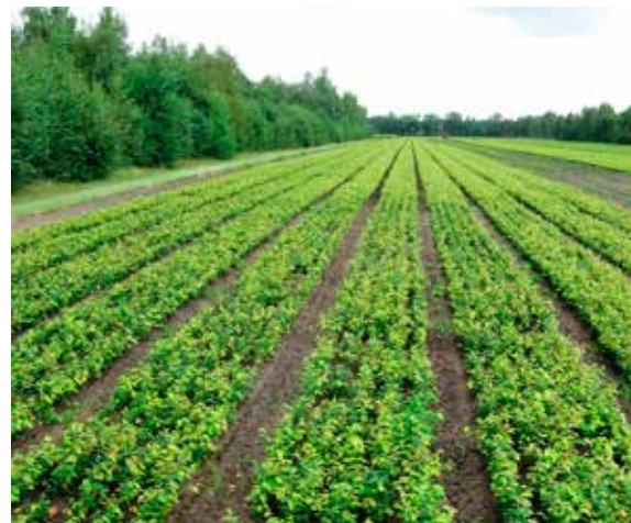
BUCHENBEETE, ANZUCHT VON SETZLINGEN

Dabei achten wir auf eine breite genetische Basis, denn je vielfältiger die Erbanlagen, desto höher ist die Anpassungsfähigkeit zukünftiger Wälder an sich ändernde Umweltbedingungen wie sie der Klimawandel mit sich bringt. Mit professionellen Reinigungs- und Aufbereitungsverfahren erzeugen wir hochwertiges Saatgut mit bester Keimfähigkeit. Langjährige Erfahrung und modernste Technologien gewährleisten dabei eine schonende Verarbeitung dieses empfindlichen Naturprodukts. Durch Lagerhaltung streben wir eine kontinuierliche Bereitstellung auch über Fehlerntejahre hinweg an, denn die meisten Baum- und Straucharten bilden nicht in jedem Jahr Samen aus. So sind wir ein verlässlicher Partner für Baumschulen und Waldbesitzer, die unsere Samen für die Anzucht von Setzlingen oder für die Direktsaat in ihren Wäldern nutzen.