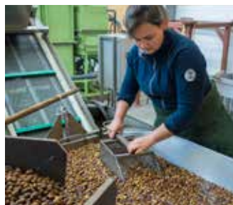
ABSCHWEMMEN DER EICHENSAMEN

Einen Teil unseres Saatgutes verwenden wir für die Anzucht von Setzlingen für die Niedersächsischen Landesforsten. Die für die Waldverjüngung benötigten Bäume und heimischen Sträucher werden in Partner-Baumschulen in kontrollierter Lohnanzucht erzeugt. So sind wir sicher, dass sie an die Standortbedingungen in den jeweiligen Waldgebieten angepasst sind und die besten Voraussetzungen für eine lange und stabile Entwicklung haben – für die Zukunft unserer Wälder!