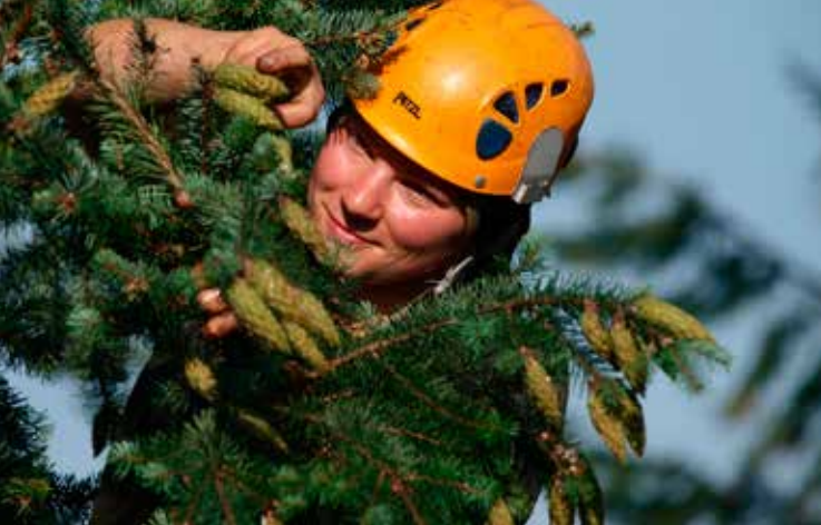
ZAPFENPFLÜCKERIN BEI DER ERNTE